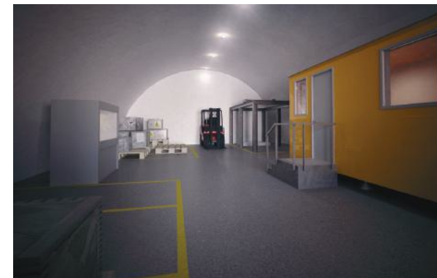
Projekcija unutrašnjosti skladišta za IRAIO

Središnje skladište za IRAIO će se realizirati rekonstrukcijom dva postojeća skladišta, dok će se Dugoročno skladište izgraditi na lokaciji preostala tri postojeća skladišta koja će se srušiti. Administrativne građevine, koje će sačinjavati upravna zgrada i objekt za kontrolu ulaza, smjestit će se uz internu cestu nedaleko od postojećeg ulaza u Kompleks.