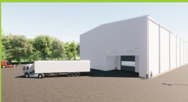
Model budućeg skladišta za NSRAO iz NE Krško

Principi temeljem kojih se skladišta projektiraju i grade slijede stroga i provjerena međunarodna pravila i propise čijom primjenom se osigurava da otpad koji će se skladištiti u Centru ne može imati nikakav utjecaj na okoliš. Otpad koji će se skladištiti u Centru je nisko i srednje radioaktivni otpad koji se već više desetaka godina skladišti u NE Krško i u stanju kakvom je nije imao nikakav utjecaj na okoliš što dokazuju stalna mjerenja oko elektrane i ishođenje dozvole za produženi rad NEK do 2043. godine.